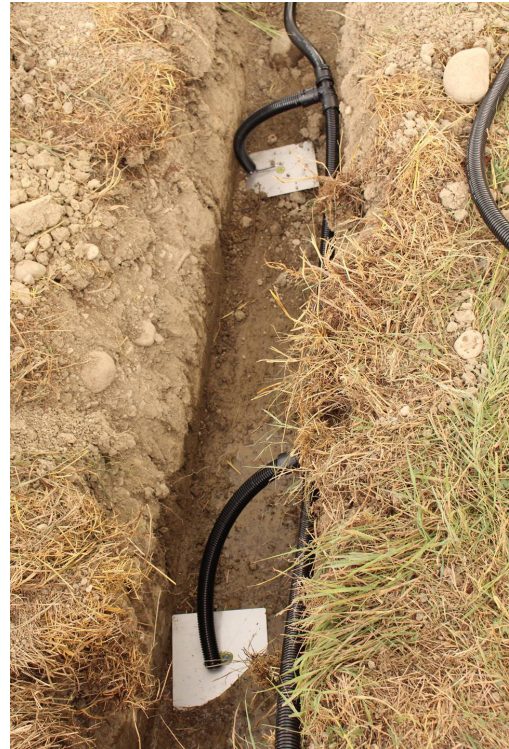
Fig. 1 - Cavi, ricoperti da una guaina anti roditore ed equipaggiati con elettrodi a piastra, allocati in trincea

fornisce validi risultati per la valutazione della distribuzione dell'acqua all'interno del rilevato, sia da un punto di vista qualitativo, sia da un punto di vista quantitativo. Grazie alla trasformazione delle mappe di resistività in mappe di contenuto d'acqua è possibile valutare le zone con un